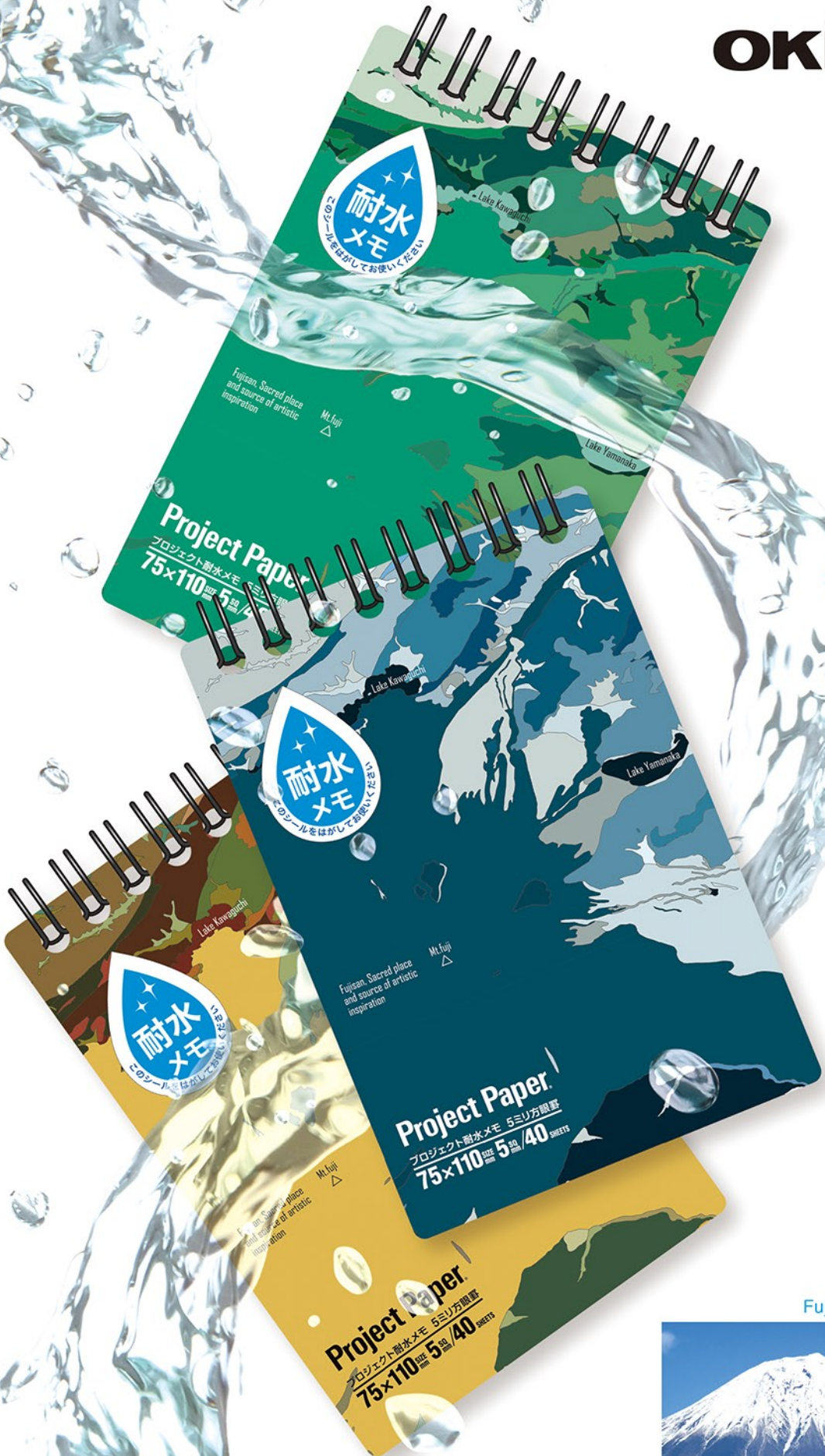
Fujisan (Mt. Fuji)