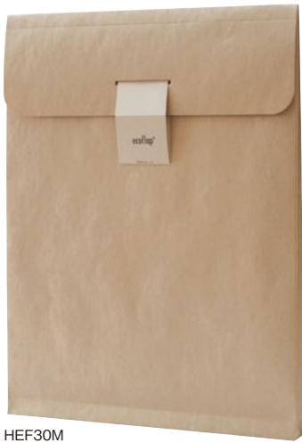
HEF30M 角形0号 290 x 390 x マチ35 mm 120g/m 2 (B4サイズが入ります)