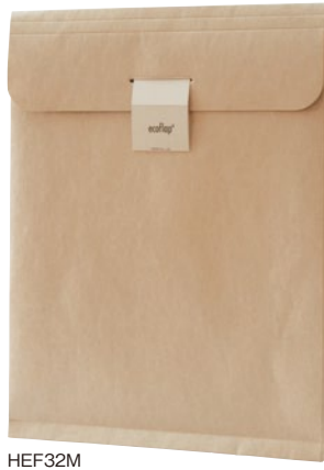
HEF32M 角形2号 253 x 335 x マチ30 mm 120g/m 2 (A4サイズが入ります)